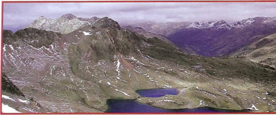
Estans de Baiau, al Parc Natural de l'Alt Pirineu, Catalunya, vists des del port de Baiau (GR11)