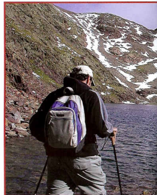
Excursionista arribant a l'estany Negre. GR11