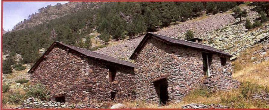
Bordes de la Coruvilla, prop dels límits de l'espai protegit. GR11.1