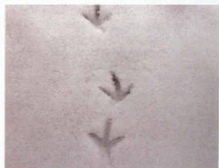
Petjades de perdiu blanca ( Lagopus muta ) a la neu