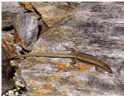
Serenalla (o sargantana de la Peña de Francia) pallaresa ( Iberolacerta aurelioi )

Sobre el traçat d'una d'aquelles rutes tradicionals, la que comunicava Àreu i Arinsal, discorre actualment el tram de GR11 que passa pel Parc Natural Comunal de les Valls del Comapedrosa. El GR11.1 n'és una variant. La xarxa de senders del parc es complementa amb un bocí del GRP.